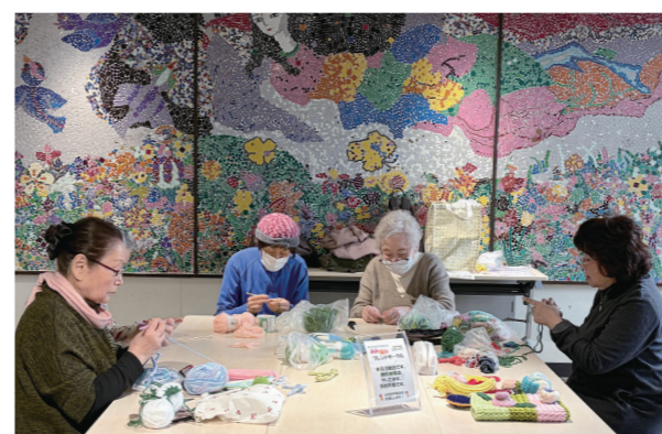
みなさんそれぞれのペースで編み物を楽しんでいます

テラスの部活動に新しく「あみ編みフレンドサークル」が加入しました。編み物とおして、地域のみなさんと交流し、作品づくりを楽しむ活動です。