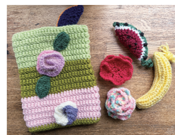
写真の左側の作品が「ケアマフ」。まずはネジネジや3色ボール、まきまきバラなどのアクセサリー小物を作っていきます。

編み物は指先を動かすことで頭の体操になるだけでなく、成果が目に見える楽しさもあります。世代を超えた会話が生まれるのも魅力のひとつ。もちろん、